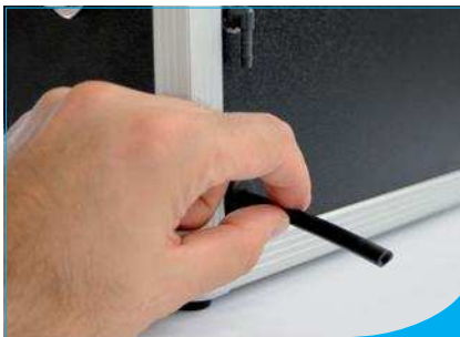
NOUVEAU : Mallette cadre aluminium et purge du pot sans démontage